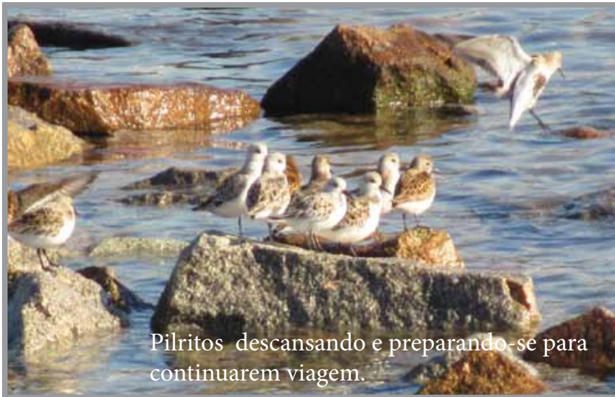
Pilritos descansando e preparando-se para continuarem viagem.

O Dia Mundial das Aves Migratórias é uma iniciativa anual de sensibilização global (iniciada em 1993), pretendendo promover a conservação das aves migratórias e os seus habitats. Promovido pelo Secretariado para o Acordo sobre Aves Aquáticas Migratórias Africano-Euroasiáticas (AEWA), em colaboração com o Secretariado da Convenção sobre a Conservação de Espécies Migratórias de Animais Selvagens (CMS)– dois acordos internacionais sob a égide do Programa das Nações Unidas para o Meio Ambiente (PNUMA), no sentido de contribuir para mostrar que a questão da conservação das espécies migratórias é global.